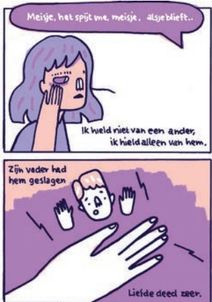
© MANON BIJKERK & DOEKE VAN NUIJL