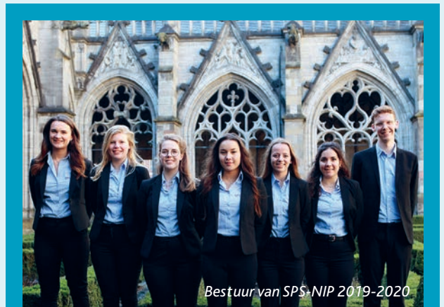
Bestuur van SPS-NIP 2019-2020

Het is jouw jaar dus grijp alle kansen om jezelf te verbreden! Tijdens een bestuursjaar krijg je enorm veel kansen om naar interessante bijeenkomsten te gaan, jezelf te ontwikkelen op verschillende vlakken en buiten je comfort-zone te stappen. Pak deze kansen zodat je jezelf optimaal kan ontwikkelen tijdens dit jaar. Het belangrijkste is dat het een leerzaam en waardevol jaar wordt, dus ga uitdagingen aan die dit mogelijk kunnen maken!